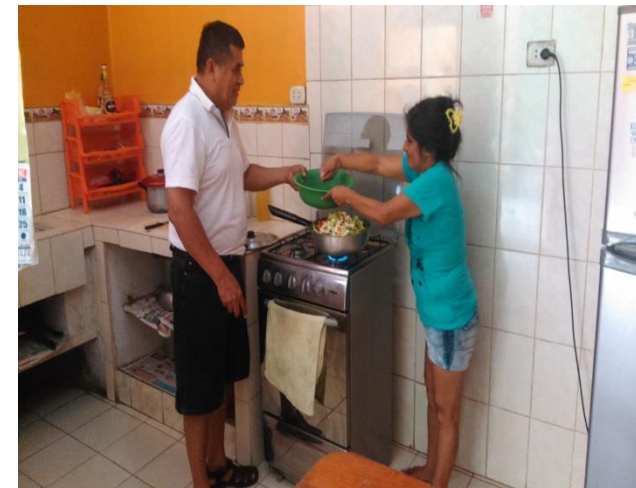
Hogar de Mujeres Iquitos