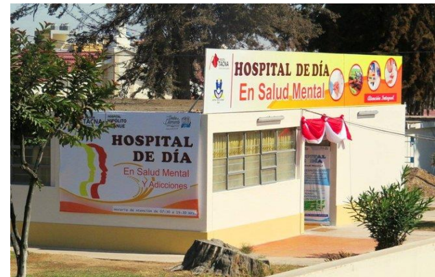
Servicio de Hospital de Día del Hospital Regional de Tacna, 2015