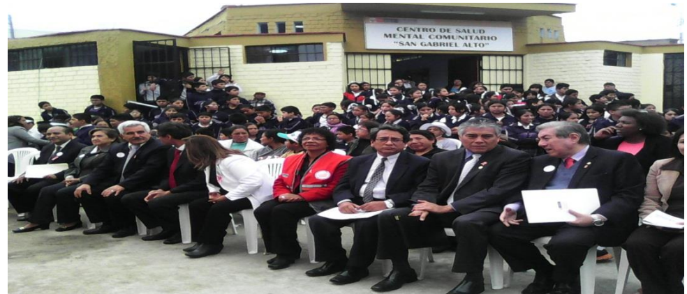
Inauguración y campañas de difusión a la población