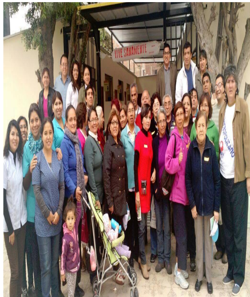
Talleres de Adulto Mayor