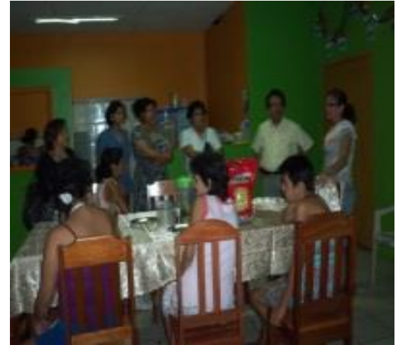
Residencia protegida de mujeres Iquitos