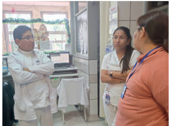
Conversación con médicos residentes del Iren Centro.