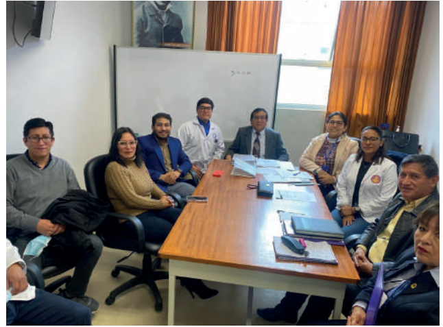
Ambientes de formación y representantes del Hospital Regional Docente Clínico Quirúrgico Daniel Alcides Carrión de Huancayo.