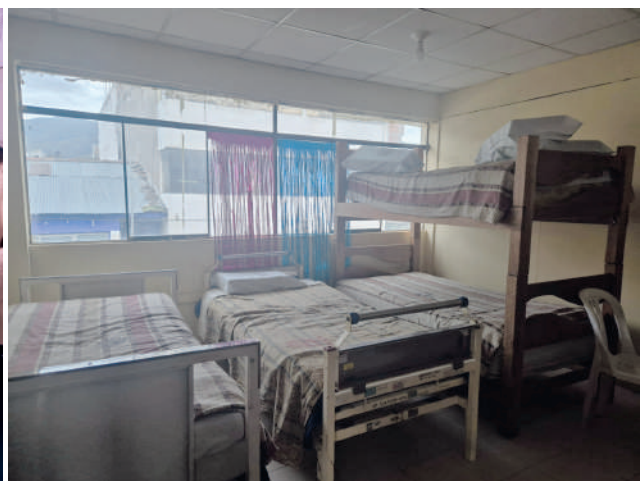
Médicos residentes y ambientes de residencia del Hospital Regional Docente Materno Infantil El Carmen, en la ciudad de Huancayo.